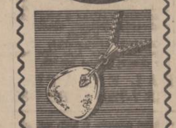
Precious Amber Nugget with Golden Rope Chain.

She'll treasure this necklace in today's smartest vogue, because it can also be worn as a good health charm on her broochet. An exquisite gift of precious amber... at an exceptionally low, low price.