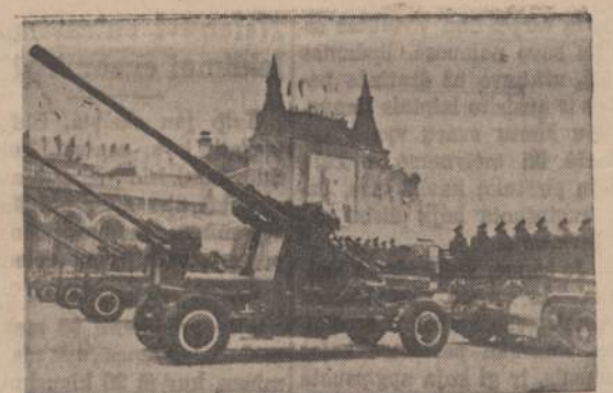
Sovietų Rusijos bolševikai šventė 42 metų savo "revoliucijos" sukaktį, šį kartą mažiau brazdinami ginklais, o daugiau kalbėdami apie "taiką, geroje ir progresą". Vaizde raudonoji artilerija traukia pro Lenino atvaizdą Maskvos Raudonojoje alkatėje.