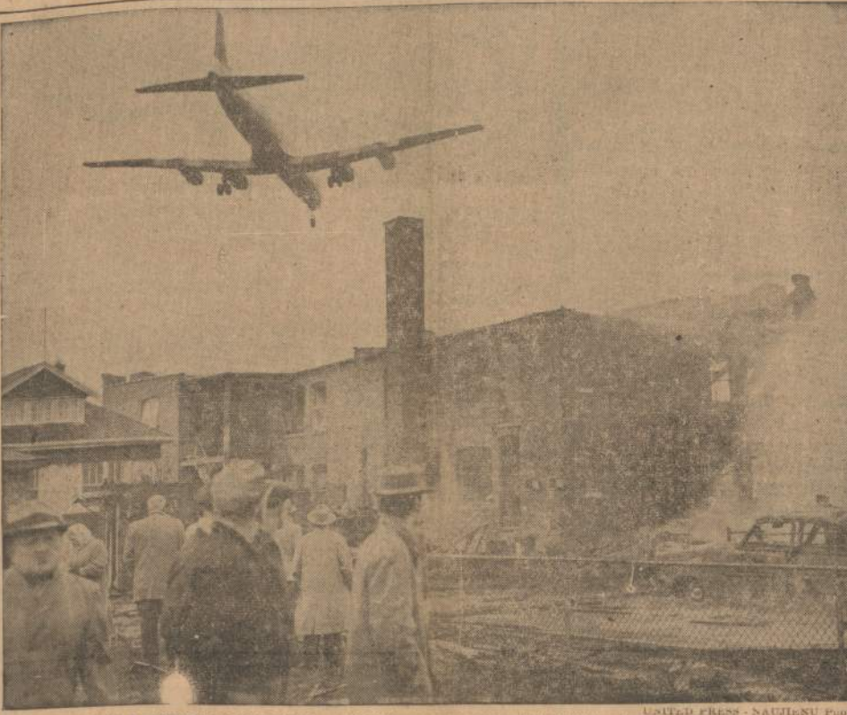
LEKTUVO KATASTROFA CHICAGOJE. — Vaizde matoma, kaip didieji lėktuvai nusileidžia Midway aerodrome, atskridami pietryčių-šiaurvakarių kryptimi lygiai per tą vietą, kur antradienio rytą nukrito keturmotorinis World Air Line lėktuvas, suardydamas keletą namų ir užmušdamas 11 žmonių ir keletą sužeiddamas.