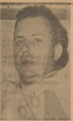
Maž. William A. Morgan, buvęs amerikietis iš Toledo, Ohio, išsiųs savo išliuotame kambaryje Havanaje, kur ginkluoti Castro kariniai jį visa laiką saugo nuo pasikėsinimų prieš jį gyvybę. Morgan pareiškė spaudai, kad Dominikonų respublikos diktatorius Rafael Trujillo žadėjo sumokėti $500,000 bet kam, kas Morgana pagaus ir jam pristatys gyvą.

"Būtų didelis įsivaizdavimas manyti, kad gyvybė yra galima tik mūsų žemėje", jis pasakė. (Pabaiga)