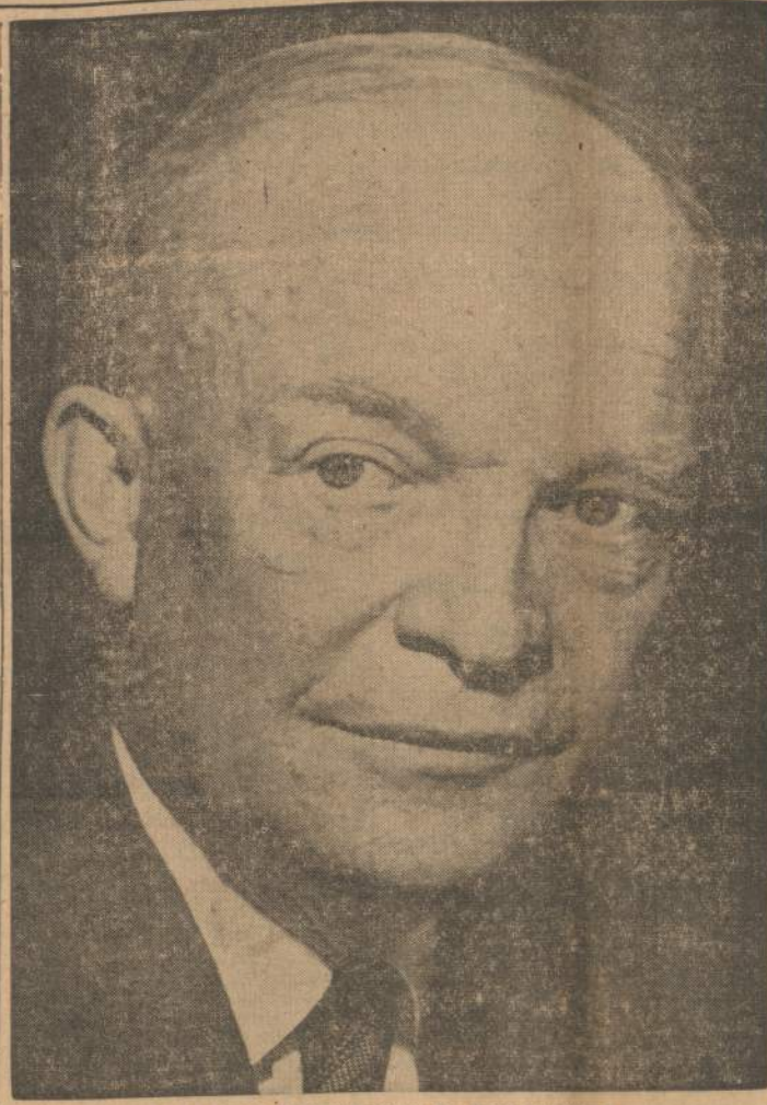
PREZIDENTAS DWIGHT D. EISENHOWER

Rasta 260 lavonų. Daugiau kaip 100 žmonių yra dingusių. Tas reiška, kad žuvusiųjų bus nemažiau, kaip 300.