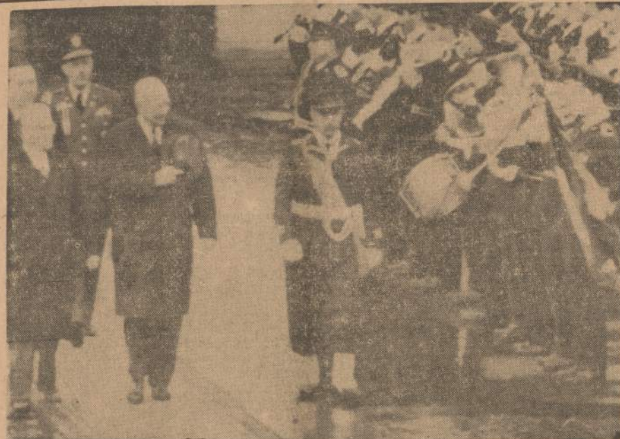
Amerikos prezidentas atskrenda į Romą, kur su Italijos prezidentu Giovanni Gronchi (kairėje) praėina garbės sargybas. Prezidentą Romoje pasitiko ne tik didelės minios žmonių, bet ir didelė audra su smarkiu lietuviu.