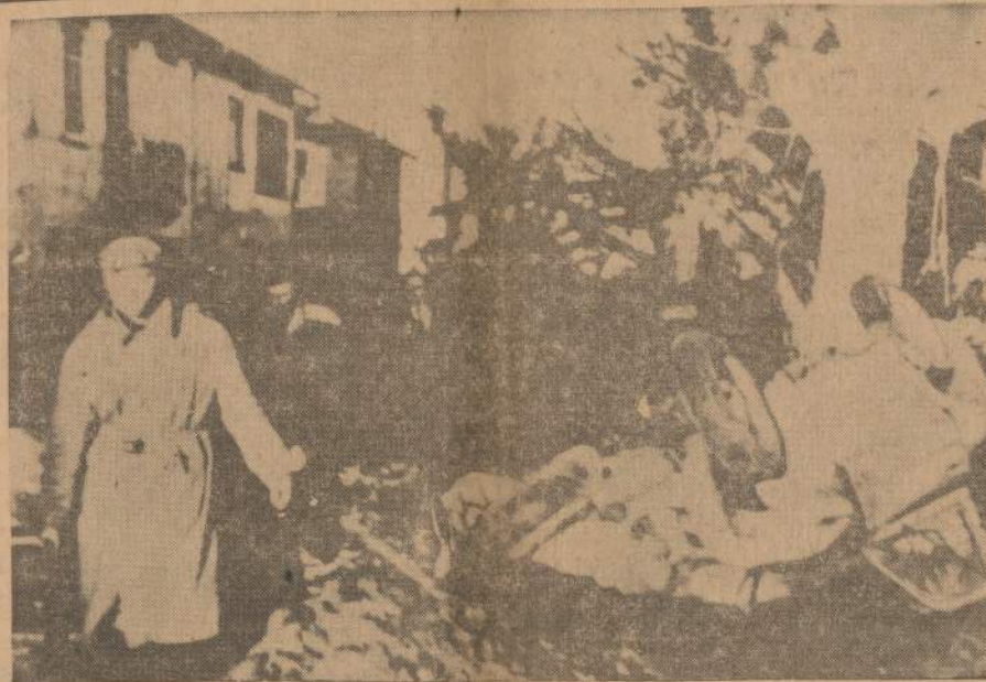
Gelbėjimo komandos neša ant neštuvų sužeistuosius iš tvano prie Frejus, Prancūzijoje, kur vanduo pralaužė tvėnkinį užliejo slėnį su jame buvusiu miesteliu, kur žuvo daugiau kaip 300 žmonių.

Milžiniškos pinigų sumos skiriamos vaistų reklamai, propagandai ir gydytojų smegenų plovimui, tęsė Seymour Blackman. Gydytojai neberašo vaistų pagal jų chemišką ir lotynišką pavadinimus, o nurodo tik vaistų prekybinius vardus, kurių išre-