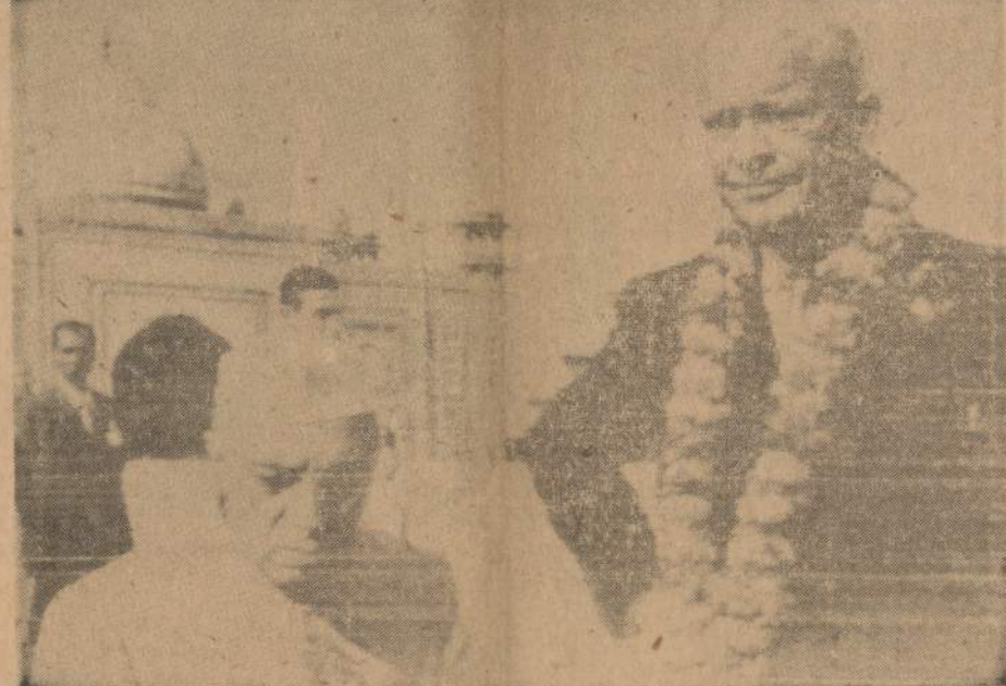
Prezidentas Eisenhoweris ir Indijos premjeras Nehru lanko garsiausią pasaulį pastatą Taj Mahal, kurį vienas šachas pastatė savo mirusios jaunos žmonos atminimui Agra mieste.