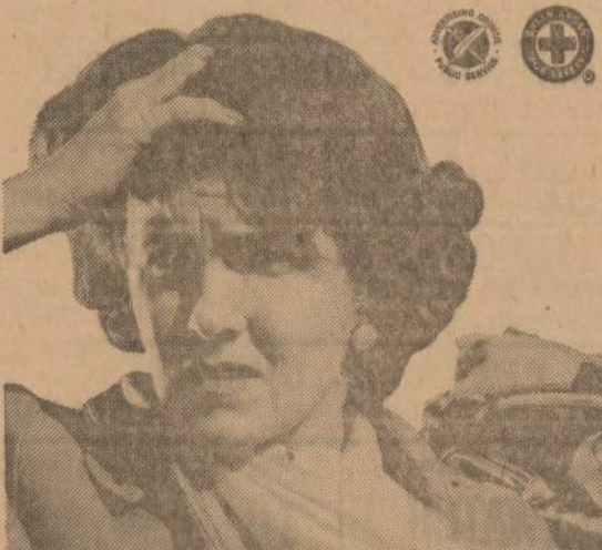
Where traffic laws are obeyed and enforced, deaths go DOWN!

When your mind's upset, your car may be too! Your thoughts can't be in two places at once. At the wheel, there's only one safe place for them—on your driving. 37,000 Americans died on our highways last year; 37 times that many were injured. The tragic toll might have been far less if every driver remembered this: a thinking driver is a safe driver... when his thoughts are concentrated on driving!