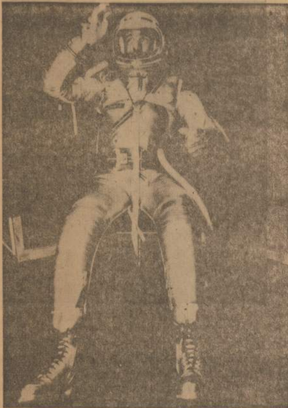
Astronautas M. Scott Carpenter tyrinėja drabužius, kokius, kaip numatoma, dėvės ir erdves skrendantieji lakūnai. Drabužis (kostiumas) čia parodytas, kuomet jį spaudžia tik penkių svarų ketvirtinai coliui atmosfera, o tokia atmosfera yra 27,000 pėdų aukštyje.