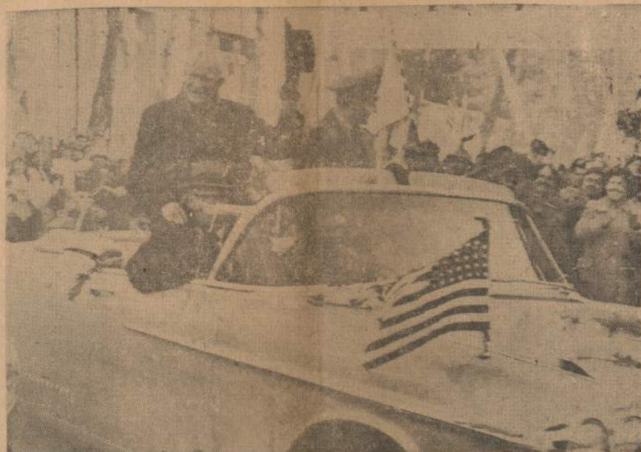
Prezidentas Eisenhoweris atsisoties automobilyje, su Persijos (Irano) šachu iš aerodromo važiuoja į sostinę Teheraną. Minios žmonių jį pasiūkio, mosuodamos amerikoniškas vėliavas. Šveičiai sukikti persai buvo išskolę pusantros mylios kelio brangiais persiškais kilimais.

Švedija visai sąmoningai ruošiasi naujam karui, nors švedai yra neutralūs ir į jokią karinį bloką dėtis nenori. Bet šve-