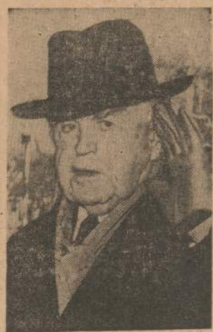
John L. Lewis, 79 metų, išbuves anglikasių unijos vadu 40 metų, pasitraukia į pensiją.

Is Liberijos prekinio laivo Amerikos karo laivas išgelbėjo 17 jūrininkų. Laivas nuskendo ties San Francisco pakraščiais.