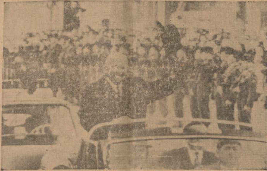
Prezidentas Eisenhoweris, atplaukęs į Prancūziją, važiuodamas Toulono miesto gatvėmis moja jį sveikinantiems prancūzams.

Jie šnipinėo Rytinei Vokietijai. Teisėjas tačiau prisiekusiųjų teismo sprendimą pakeitė. Jis išaiškino, kad kaltinamieji tik krenybė nebuvo šnipai. Būtų reikėję juos bausti iki 16 metų kalėjimo. Jie tik nelegaliai rinkę slapta žinias, už ką galima bausti iki 6 metų kalėjimo.