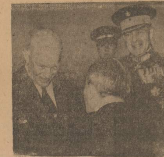
Arkiokis karalius Povilas atvažiuos iš Teherano į Atėnus su pažindina prezidentą Eisenhowerį su nariais savo vyriausybės.