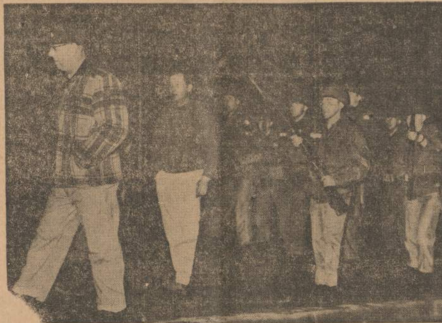
Nacionalinės gvardijos kariai pilnoje karo aprangoje saugo Wilson kompanijos pakavimo dirbtuves prie Albert Lea, Minn., durtuvais varydami šalin streikuojančius darbininkus ir jų piketus po to, kai dirbtuves buvo uždarytos.