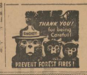
Vertė A. Z.

— Linksmas žmogus, — at-sakydavo jis man kiekvieną kartą ir susijuokdavo.