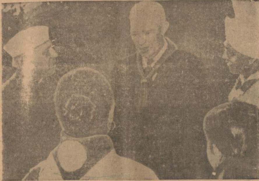
Prezidentas Eisenhoweris (centre), pasirūšęs skautų kaklaryšį, kalbasi su Indijos berniukais ir mergaitėmis skautais New Delhi mieste. (Indijos premieras Nehru kairėje). Prezidentas Eisenhoweris pasiūlė tautoms kuo daugiau keistis savo studentais, kaip geriausiu būdu vienoms kitas pažinti.

Kiek iš viso pabėgėlių? Iš konferencijos duomenų paaiškėjo, kad neįeinančių į J. Tautų globą vokiečių tautybės pabėgėlių (tremtinių) 1958 m. rugs. 30 d. buvo: 9,339,000 iškraustyti iš Lenkijos ir Sovietų Sąjungos užimtų sričių, iš jų 191,000 gyvena stovyklose; 3,196,000 pabėgėlių iš Vokietijos