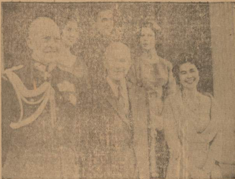
Aplanko karališka šeima — Prez. Eisenhoweris, prieš išvykdamas į Tunisą, fotografuoja- mas ant Afėnų Karališkųjų Rūmų laiptų kartu su Graikijos karalium Pauliu ir karaliene Fre- derika; už jų — karališkosios poros vaikai.

1. Kiekvienai ateivių šeimai buvo duota 25 hektarai miško nemokamai, bet ta sąlyga, kad per 3 metus to miško ploto vieną trečdalią ateivių šeima pavers dirbama žeme. O to miško medžiai daugumoje seni, stori ir kai kurie labai kietos rūšies. Su paprastu rankiniu pūkle ir kir- viu ne visus medžius žmogus gali įveikti, o kokių nors me- chanizuotų priemonių naujieji ateiviai nepajėgė psigyti. Kita vertus, mechanizuotoms prie- monėms būtų reikalinga elektros srovė, o jos ten nebuvo. Alyva kurenami motorai būtų parei- kalavę tokių lėšų, apie kokias naujieji ateiviai nė svajoti ne- galėjo. Todėl kiečiausias sto- riausias medžius galėjo tik išle- ginti, ir aštuonis hektarus miš- ko paversti ariama žeme buvo labai didelis ir sunkus darbas. Fiziniai silpnesnės šeimos nu-