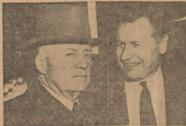
Texas demokratų partijos Pirminis Numeris Sam Rayburn ir New Yorko gubernatorius Nelson Rockefelleris susitikę bevažinėjant su prakalbamis Dallas srityje.