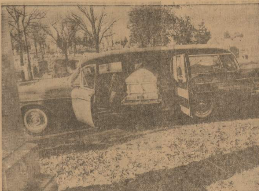
Roger Touhy karstas prieš palaikojant Mount Carmel kapinėse. Touhy, buvęs galingas bulve- gerių baronas prohibicijos laikais, išsėdėjęs 25 metus kalėjime, prieš keletą dienų gangsterių nu- šautas, buvo palaidotas be jokio ceremonijų, net be gėlių.

Dėl Urugvajaus ukrainiečių ir lietuvių pionierių kolonijų žlu- gimo priežasčių daug teirautis inereikėjo, nes jos savaime buvo