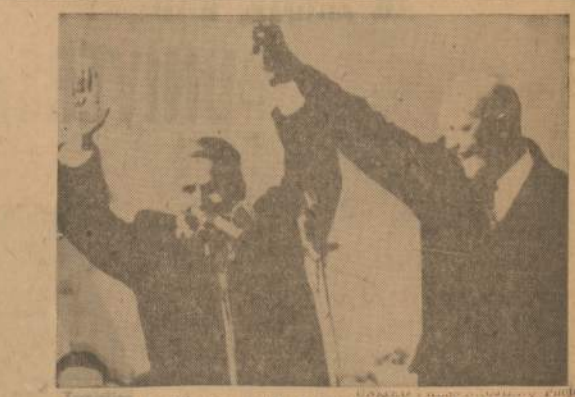
Tunizijos prezidentas Habib Burgiba (kairėje) laiko prezidentu Eisenhowerį už rankos, šiam atvykus su vizitu ir pasakius kalbą Tunise. Iš čia prieš 16 metų Eisenhower, kaip vyriausias sąjungininkų vadas, vadovavo invazijai į Sicilijos salą.

Žadėtos baltos Kalėdos neišpildė, kai prieš pat šventės pavyriausybė, kažin kas Lenkijoje šiandien būtų. Kaip atsimenama, Amerikos viceprezidentas Nixonas Varšuvoje buvo sutiktas nepaprastai entuziastingai. Jei Lenkija iš Amerikos taip lengvai gavo 100 milijonų dolerių ir daugiau, dėl ko nepareikšti prideramą pagarbą "dėdei iš Amerikos".