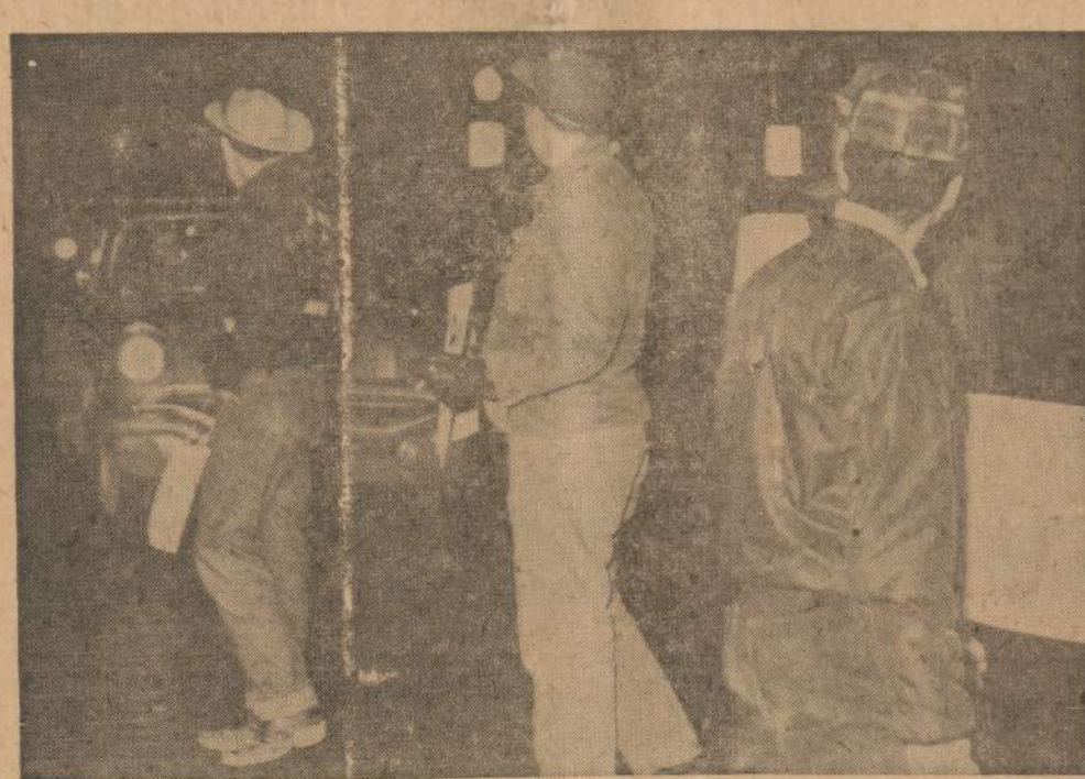
Neįsileidžia streiklaužius. — Streikuojantieji Wilson ir komp. dirbtuvių darbininkai laikinai neleidžia nestreikuojantiems įiti į dirbtuvę Cedar Rapids, Iowa, vaikščiodami priekyje automobilių. Valstybės policija nuvokė streikuojančius nuo įėjimo, bet niko nesuėmė.