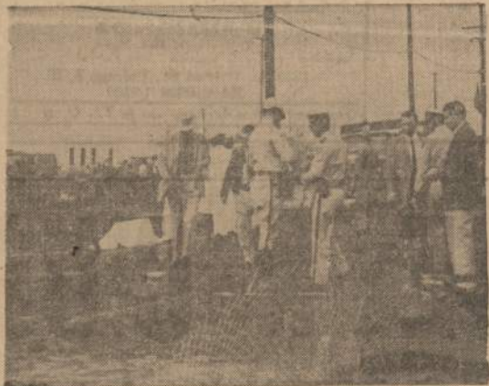
MIRTIS IS DANGAUS. — Tucson, Arizonoje, į gatvę nukrito karinė bombonešio lėktuvo benzino tankas, pataikydamas tiesiai ant dviračių jojusios moters, kuri buvo užmūšta vietoje.

Sulaukus Naujų Metų, linkiu daug laimės ir geros sveikatos SPORTININKAM ir GEROS VALIOS LIETUVIAM.