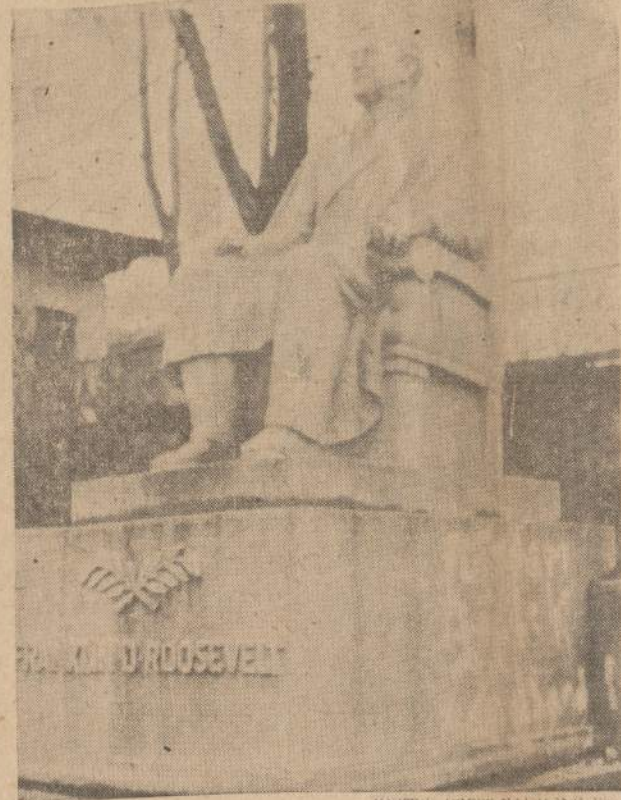
Buv. Amerikos prezidento Franklino Delano Roosevelto paminklas Oslo mieste, Norvegijoje, buvo apterliotas antisemitizmo šūkiais. Baltais dažais iššepelotas sakinyvų norvegų kalba: "Potsdamo Joediak Landhandler", reiškia "Potsdamo žydų perkupčius."

Anglijos ministeris pirminkas Macmillan, pradėdamas kelionę po Britų bendruomenės šalis nuo Ganos Afrikoj, buvo gana šaltai priimtas. Ganos premjeras Nkrumah pasakė, kad Afrikos šalis kurs savo tautų bendruomenę ir dėl šio tikslo aukos savo iškovotą suverenumą.