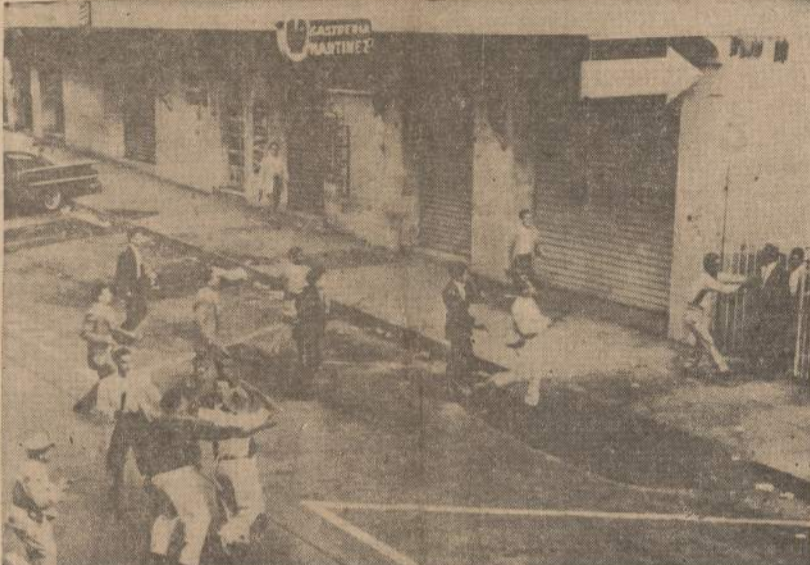
Per bedarbių riaušes Caracas, Venesueloje, policijai pavartojus šautuvus ir lazdas, ivyko masinės demonstracijos, kurioms numatinti policijai į pagalbą buvo atsiųsta kariuomenė. Įtrūsi mi-nia gatvėse daužė langus, degino automobilius ir plėšė krautuves. Vienas ispanas imigrantas užmuštas.

į Šiaurės Korėją išplauks ketvirtas Sovietų laivas su korėjiečiais, kurie nori apsigyventi pas komunistus. Laivai paima po 1,000 repatriantų. Repatriaciją Japonijoje tvarko korėjiečiai komunistai. Iš 600,000 korėjiečių Japonijoje jau užsirašė 6,000 repatriuoti į Šiaurės Korėją.