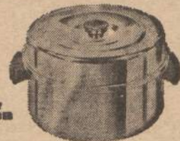
JULY - OCTOBER 8 QUART ROUND ROASTER