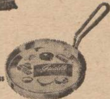
MARCH - APRIL GREASLESS-SMOKELESS Multi-Use GRIDDLE