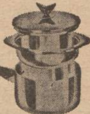
NOVEMBER - DECEMBER 8 QT. COMBINATION COOKER

NOTE: ONLY ONE GIFT TO ANY ONE FAMILY DURING ANY TWO-MONTH PERIOD. TO QUALIFY FOR GIFTS THE ACCOUNT SHOULD SHOW A NET INCREASE DURING THE TWO-MONTH PERIOD OF NOT LESS THAN $500.00.