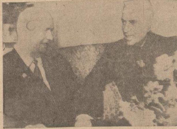
Nikita Chruščiovas (kairėje) su Indijos premjeru pastarąjo rezidencijoje New Delhi mieste, kur įjėdu keletą kartų tarėsi apie tarptautinę padėtį.

— Britanija iš užsienio prekybos vien per sausio mėnesį turėjo $885 mil. pelno. Už tokią sumą anglai daugiau pardavė užsienį, negu kad pirkė.