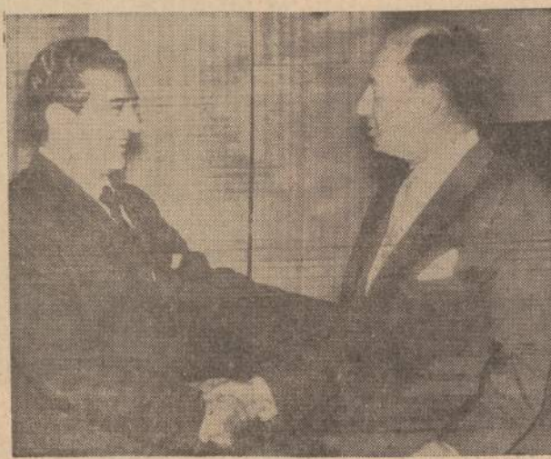
Buvęs Illinois gubernatorių ir kandidatas į JAV prezidentus Adlai Stevensonas sveikina su Meksikos prezidentu Lopez Mateos Meksikos mieste, kur susitjo pakeliui į Guatemala, Kostariką ir kitas Pietų Amerikos valstybes.