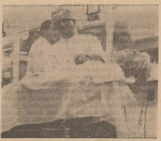
Buves ilgametis Amerikos angliakasu unijos vadas, pasitraukęs iš unijos prezidento pareigų, John L. Lewis patogiai atsigulęs kirpėjo kėdėje laukia, kol kirpėjas pradės jį genėti.