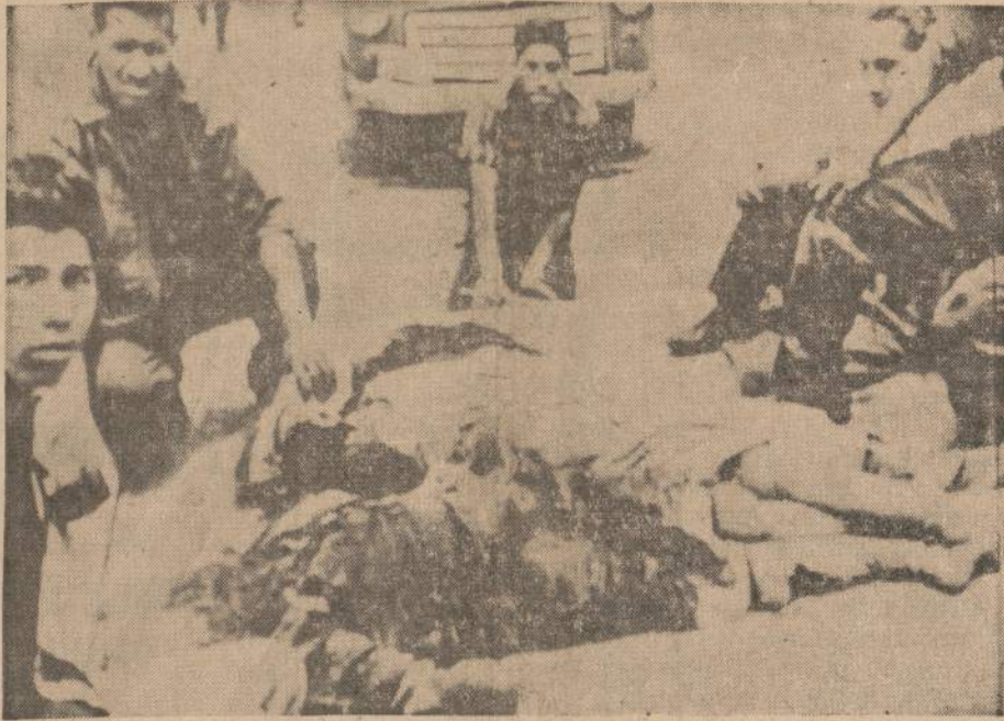
Po žemės drebėjimo Arequipa mieste, Peru, Pietinėje Amerikoje, žmonės renka sužeistuosius ir užmušuosius.