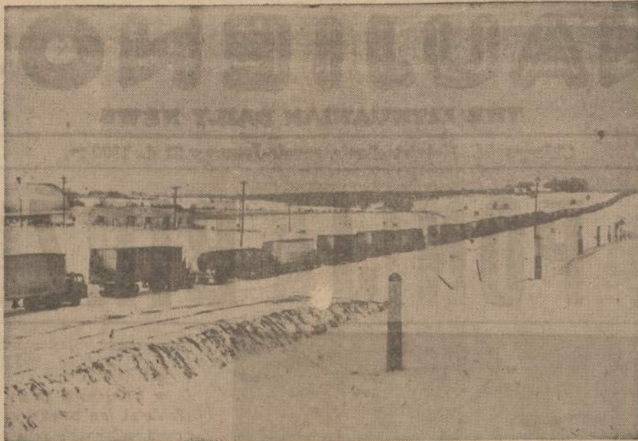
Kiek akys užmato eilę sunkvežimių ir automobilių, susikimę US plente No. 41 ir rytus nuo Racine, Wisconsin, kur šiuriam važiuoti buvo sustabdyti staiga pasnigusios storos sniego dangos su smarkia audra ir pūstymais.