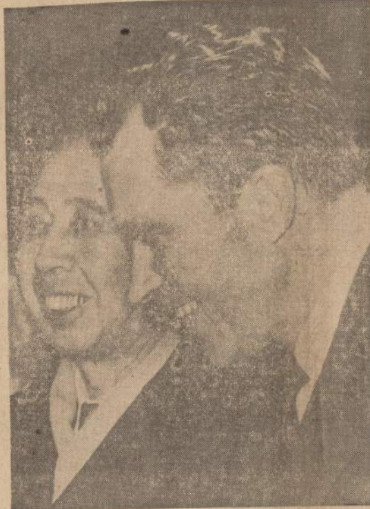
Japonijos ministris pirmininkas Nobusuke Kishi (kairėje) susitinka su viceprezidentu Nixon Washington, kur jis atvažiavo pasirašyti apsigynimo sutarties tarp Japonijos ir Jungtinių Valstybių.

Kad De Gaulle nevisiškai sutramdė populeryj parašutininkų.