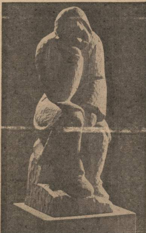
Skulpt. DAGYS — "Mano tėviškės žmogus"