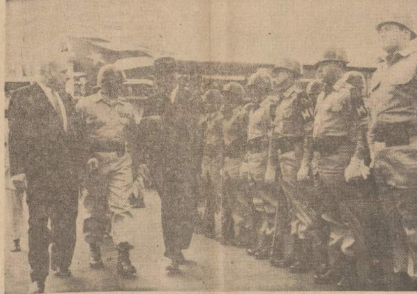
Prezidentas Eisenhoweris ir Portoriko gubernatorius Luis Munoz Marin eina prie kalbėtojų tribūnos. Prezidentas atskrido į San Juan, Porto Riko.

KALKUTA, Indija. — Liaudies socialistų vadas Kripalani pasakė viešoj kalboj, kad premjeras Nehru, pakviesdamas komunistinės Kinijos premjerą Chou En-lai deryboms, apgavo Indijos tautą. Nehru atsiskyrė ir savo sąlygų, kuriomis jis sutiko derėtis anksčiau — kad Kinija atsitrauktų iš užimto Indijos žemių. Nehru į tai atsiliepė, kad jis pasitrauktų iš premjeru, jei jausitųsi apgavęs tautą. Kripalani, socialistų vadas, kalbėjo, kad Indijos vyriausybė net nežino, kokį plotą Indijos teritorijos yra užėmusi komunistinė Kinija. Tokių dalykų niekad nepasitaikytų jokioj kitoj šaly, stebėjosi socialistų vadas.