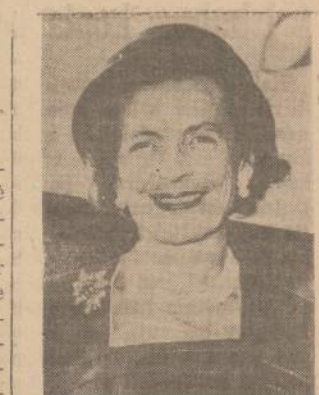
Viena turtingiausių Britanijos moterų, baronienė Edvin Mountbatten, 58 metų, princą Pilypą tėta, pasimirė šiauriniame Borneo beispektuodama Raudonąjį Kryžį. Karalienė Elzbieta su Pilypu ta proga užsėdėjo gedulo drabužius.

Dauguma negrų pietiniuose steituose nepatenka į balsuotojų sąrašus, todėl negama progos dalyvauti rinkimuose. Todėl negrai keliasi į šiaurines valstybes, kur jų teisės nėra varžomos.