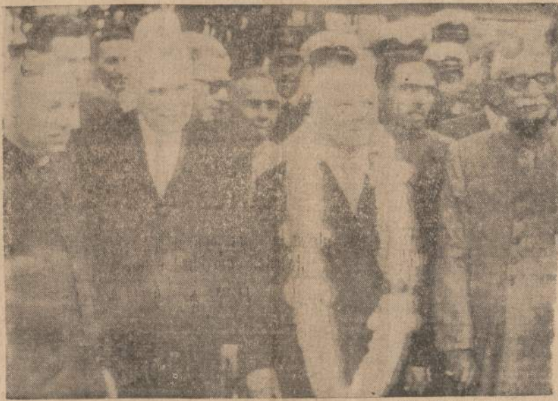
Gėlių vainiką persimetęs sovietų "prezidentas" Vorosilovas (trečias iš kairės) pasitinkamas New Delhi, Indijoje, kur jis atskrido su "geros valios" misija. Jį pasitinka ministras pirmininkas Javaharlal Nehru (kairėje) ir prezidentas Rajendra Prasad (dešinėje). Su Vorosilovu atvyko pirmasis vicepremyeras Frol Kozlovas (antras iš kairės). Nedidelis būrys žmonių svečius pasitiko aerodrome. Kita mėnesį į Indiją atvyks pats Nikita Chruščiovas.

JERUZALĖ. — Izraelio vyriausybė ruošia protesto notą Amerikai. Užsienio reikalų ministerijos atstovas pasakė, kad ši vyriausybė pasipiktino JAV laivyno pranešimu nesamdyti tų laivų alyvai gabanti, kurie palaiko ryšius su Izraelio uostais ir yra įtraukti į Arabų Lygos boikoto sąrašus. Izraelis mano, kad Amerika, nusileisdama arabų boikotui, išaugins Nasserui dar didesnius ragus.