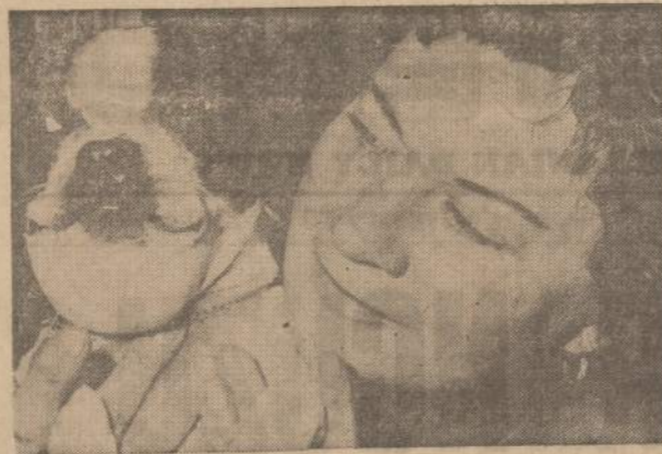
Tai ne kiaulienės liga, nuo kurios šiam Bostono buldogėliui sutino sprandas, tai bitės gelūonis, įdurtas neatsargiam sūniui besisaulėjant kažkur Floridoje.

koki. Už namų statybos darbus mažai temokėjo. Be to, kraštė prasidėjo neramumai. Vienur dragūnai atėjo, kitur žandarai žiaurėja. Iš vienos pusės japonų karas prasidėjo, iš antros pusės atsirado visokių "ciclistų", kurie priešinosi karui, ragino jaunimą neiti carui tarnauti, kovoti už savo krašto laisvę.