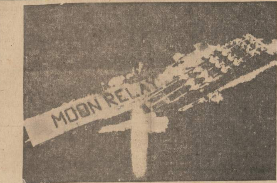
Šis paveikslas buvo gautas tokiu būdu, kad radio signalai iš Havajų buvo pasiusti pirma į mėnulį, iš kurio atsimušė grįžo į Cheltenham, Md. ir čia buvo padarytos paveikslas nuotraukos. Čia JAV laivyno už $5.5 milijonus pastatytoji komunikacijų sistema tebėra bandymų stadijoje. Paveikslas iš Havajų per mėnulį Cheltenham, apie pusę milijono mylių atstumo, buvo gautas sekundžių bėgyje.

Pirmadienį jiedu atskrido į Taškentą Azijoje ir pradės ten apžiūrėti Rusijos kolonijas, pilnas vergų, baudžiaininkų. Bet vargu jiedu juos pamatys.