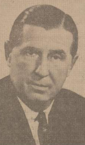
GONGR. WILLIAM T. MURPHY

Jau tikras faktas, kad Jungtinių Amerikos Valstybių Kongrese vasario 16 diena bus pašvęsta Lietuvos laisvės bylai ir ten specialiai Lietuvos reikalui kalbą pasakys mūsų čikagiškis kongresmonas WILLIAM T. MURPHY; gi kitas didis lietuvių tautos draugas, senatorius PAUL H. DOUGLAS, ir šiemet dalyvauja rengiamame Vasario Sešioliktosios minėjime Marijos aukšt. mokykloje vasario 14 dieną, kur pasakys kalbą. Čikagos miesto meras RICHARD J. DALEY ir Illinois gubernatorius STRATTON išleisdžia deklaracijas, paskelbiant vasario 16 dieną Lietuvos Dieną.