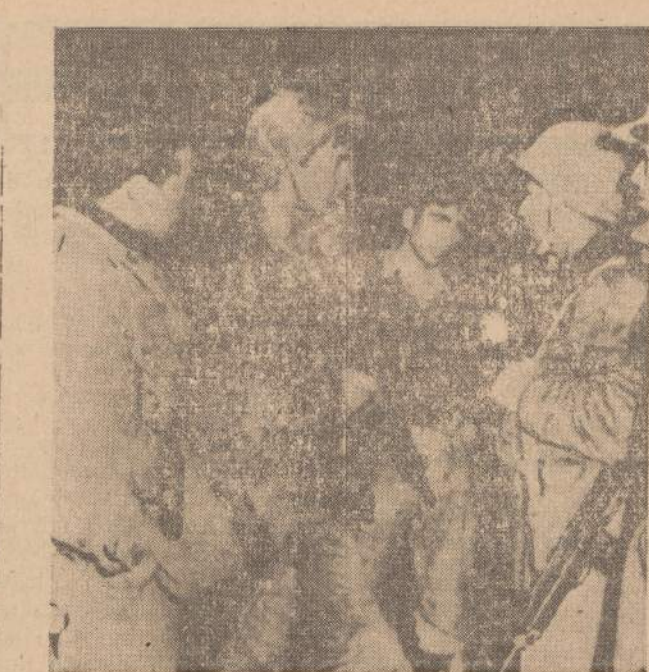
Izraelio saugumo jėgos Tel Aviv srityje grįžta iš arabų Tawafik kaimo. Po užėmimo Izraelio jėgos tą kaimą sunaikino. Antras iš kairės karys laiko sovietų pagamintą „Ak 54“ ginklą, kuris menamai buvo atimtas iš Sirijos kareivio.

Bet gražiausiai pasirodė jauniausias Stalo Nr. 14 dalyvis,