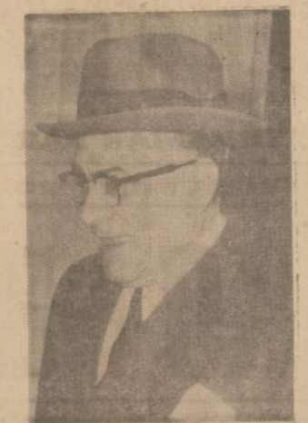
Vito Genovese atvyksta į U. S. Teismo namus New Yorke pradėti sėdėti 15 metų kalėjimo bausmę už narkotikų šmugelį.