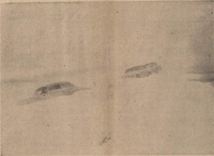
PUTRYNA PASKENDĘ IR APLEISTI AUTOMOBILIAI PIETINIAMS WISCONSINE, KUR ŠIOMIS DIENOMIS SNIEGO AUDROS SU 60 MYLIŲ GREIČIO VĖJU SUPUSTĖ KELIUOSE IR PIENIUOSE DIDELIS SNIEGO PUSNIS. ŠIS VAIZDAS PADARYTAS MILWAUKEE APYLINKESE.

Pavergtoje Lietuvoje veikiančioje Medžiotojų Draugijoje esą 10.300 narių. Tiek jų buvę praėjusių metų pabaigoje. 563 medžiotojai turi grynusius skalius ir 500 vietinės veislės skalius. Nepataria medžioklinių šunų laikymą plėsti. Šia pačia proga pažymėtina, kad pagal veikiančius nuostatus Medžiotojų Draugijos nariams Lietuvoje pavieniui medžioti draudžiama. Skatinamos grupinės medžioklės. Šiaip jau mažiausiai du medžiotojai gali medžioklėn kartu išeiti. (E).