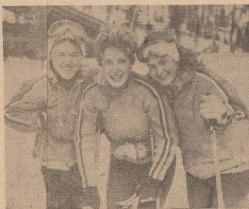
Trys graūs ski (sniego pašliužų) sportininkas šildosi Squaw Valley saulėje prieš pasikeliant į Popose kalno viršūnę.