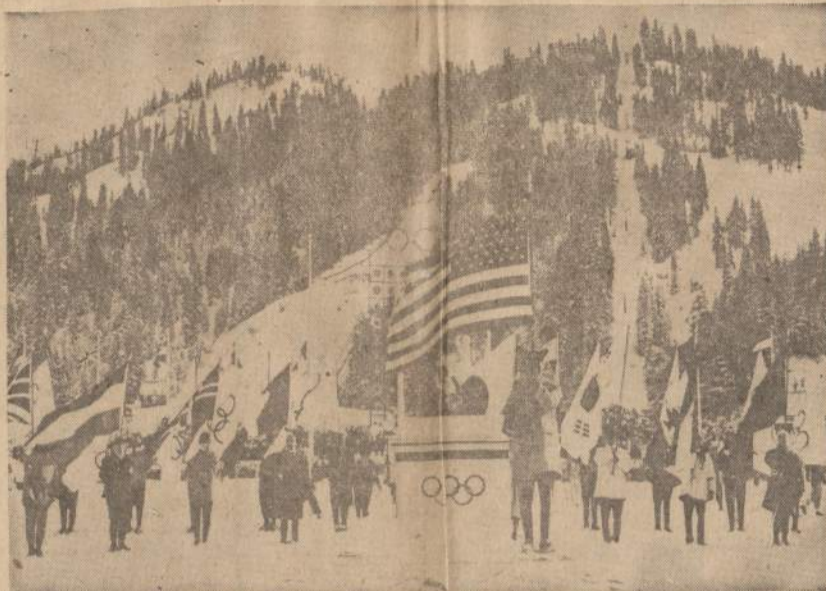
VIII Žiemos Sporto Olimpiadai prasideda Squaw Valley kalnuose, Kalifornijoje.

VARADIZ, Jugoslavija. — Austrijos katalikų bažnyčios galva kardinolas Franz Koenig buvo pargabentas iš liginonės helikopterių į Vieną. Jį išliko automobilio nelaimė, važiuojant į kardinolo Stepinac laidotuves Zagrebe. Susidūrus Jugoslavijoje su sunkvežimiu, jo automobilio šoferis buvo užmuštas, o kardinolas ir jo sekretorius — žūviai sužeisti.