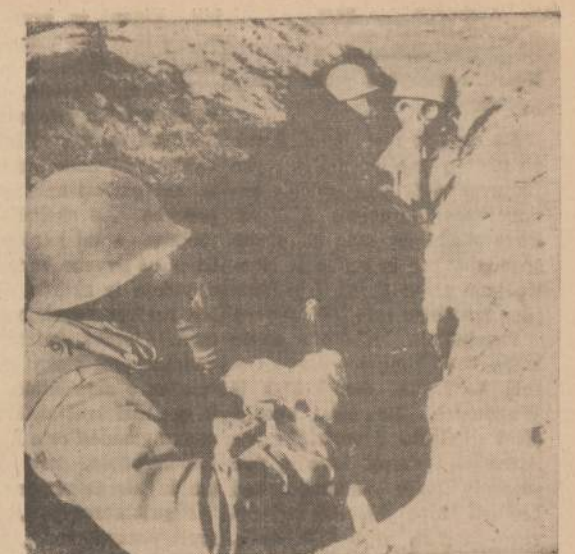
Prancūzų kareiviai paruošiami pirmajai atominėi bombai sprogdinti. Jie apmokami slaptos "atomineje" bazėje ir, spėjama, greitai laiku bus išsiųsti į Saharą, kur de Gaulle būtinai nori išsprogdinti atominę bombą...