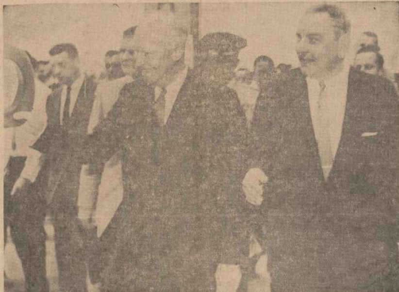
Prezidentas Eisenhoweris su Portoriko gubernatorium Luis Munoz Marin Inspektuoja garbės sarayba, išstatyta prezidentui atskridus į Isla Verde aerodromą prie San Juan, Portorikoje.

JAV vyriausybė pareiškė nepasitenkinimą dėl Vakarų Vokietijos planų įrengti karveivės, karinio apmokymo bazes Ispanijos teritorijoje.