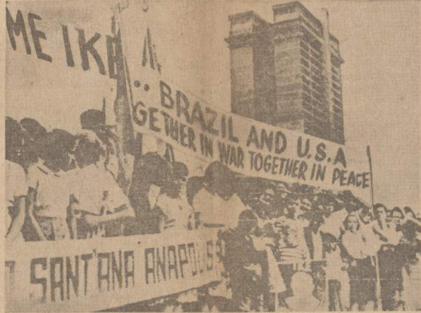
Prezidentas Eisenhoweris aplankė Brasilia miestą (Brazilijoje), kur jį pasitiko minios žmonių su plakatais, kuriuose buvo užrašyti pro-amerikoniški šūkiai.