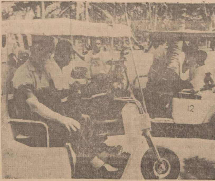
Prezidentas Eisenhoweris, grįždamas iš savo keliolikos tūkstančių mylių kelionės po Pietų Ameriką, sustojęs savaitgaliai Portorikoje, išvyko golfo žaisti.