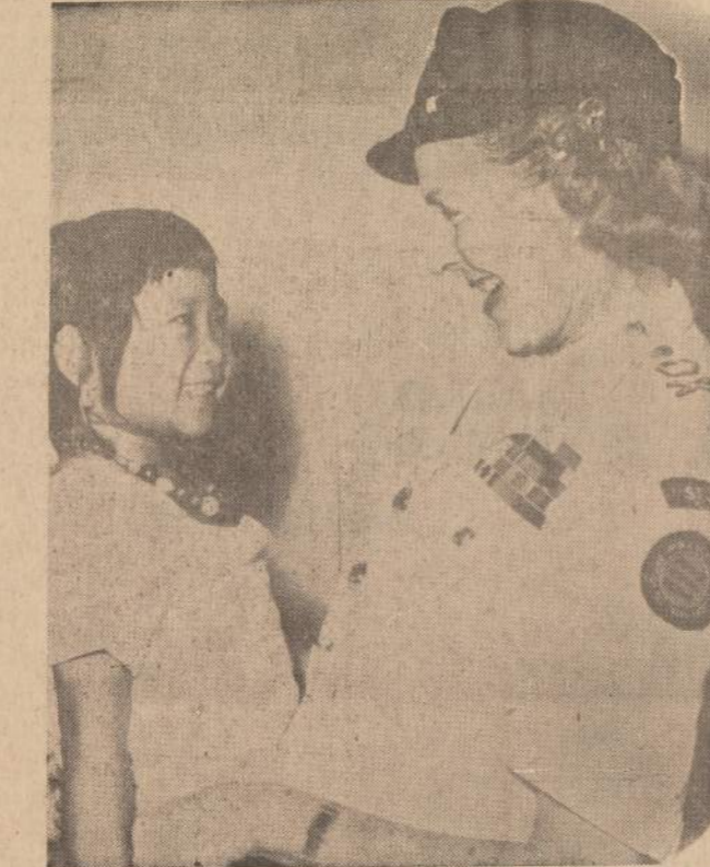
Baronienė Mountbatten, 58 metų, anglų karalienės Elzbiotos vyro Pilypo teta, mirė inspektuodama britų Raudonąjį Kryžių Borneo saloje.

sekmadien, kovo 27 dieną, dainuos Pavasariniame NAUJIENŲ bankete, kuris vyks Lietuvių Auditorijos didžiojoje salėje. Populiariausia ir čikagiečių mėgiama dainininkė dainuos arijas, duetas ir lietuviškas dainas. Skaniai paruošta ir soti lietuviškų ir amerikietiškių valgių vakarienė. Organizacijos, bendrovės ir šeimos užsakinėja stalus. Pasikiri asmenys — atskiras vietas. Vienam asmeniui tiktetas kainuoja $6.00. Tiktetus galima gauti NAUJIENŲ Administracijos arba pas NAUJIENŲ atstovus. Prašome įsigyti tiktetus ir rezervuoti vietas iš anksto.