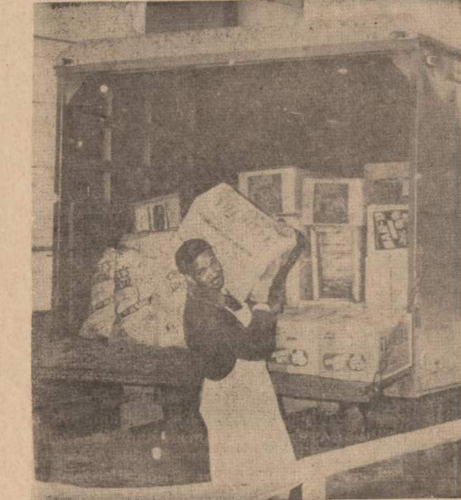
Senato restoranas Washingtono aprūpinamas papildomu maistu, kad senatoriai turėtų ko valgyti, kai prasidės 24 valandų posėdžiai civilinių teisių biliaus klausimu, kuriuo pietinių valstybių "filibusteriai" žada kalbėti ištisas dienas be paliovos.