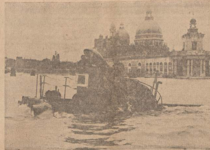
Keletas raginys Venecijos lagūnose, kur paprastai žmonės tik gondolomis plaukioja. Čia matomas 50 tonų amerikiečių povandeninis laivukas, naudojamas filmui išbandyti gyvenimo sukči. Tame filme bandyta pabėgti povandeniniu laivu.

Lenkų sostinė Varšuva per karą buvo gana smarkiai sugriauta ir dar toli gražu nustačiusi. Matyti, daug griuvėsių apaugusių žole, ištiesi sugriauti kvartalai nepaliesti dar