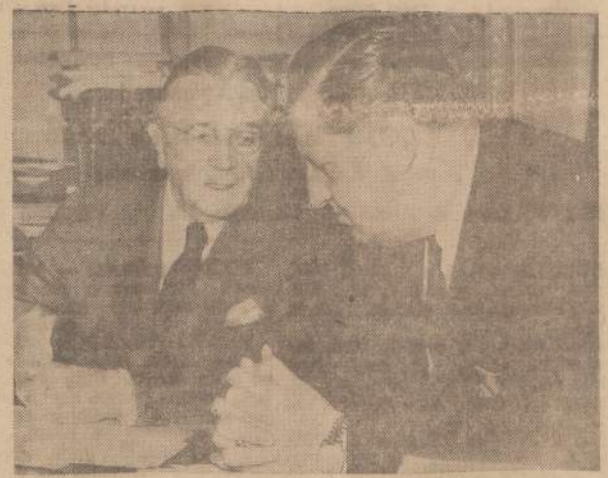
Buvęs generolo MacArthuro karinės įvalybos karininkas gen. maj. Charles Willoughby kongreso komitete kritikuoja ligšiolinę karinės pagalbos tiekimo programą.