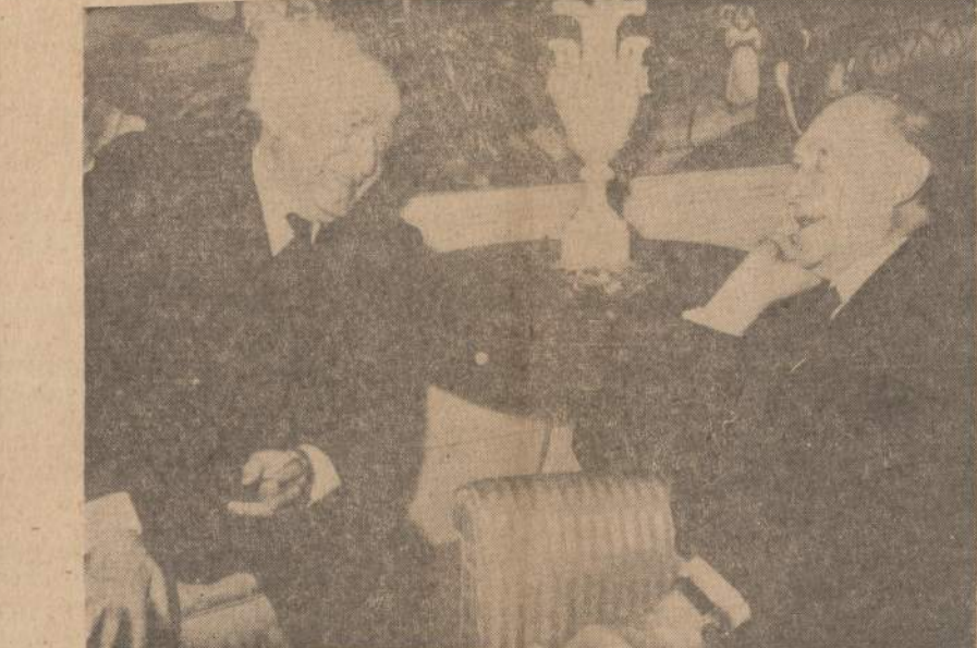
Izraelio ministras pirmininkas David Ben-Gurion (kairėje) ir Vakarinės Vokietijos kancleris Konrad Adenauer plačiomis šypsenomis baigė savo dviejų valandų pasikalbėjimą, susitikę Waldorf-Astoria viešbutyje, New Yorke.