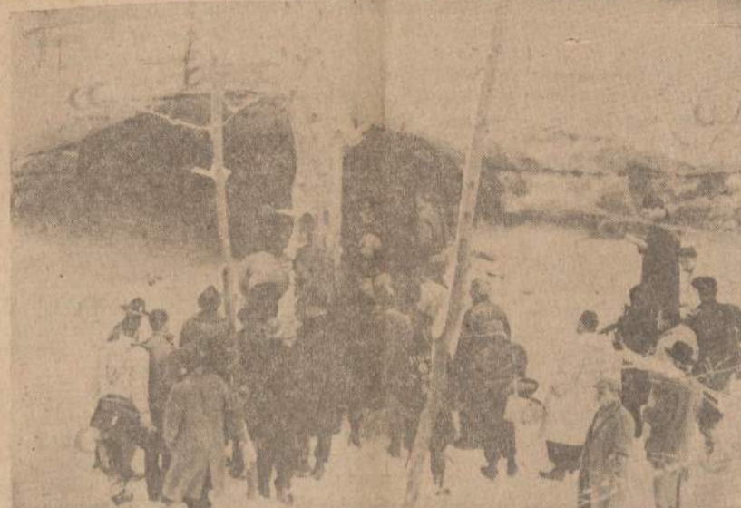
Bendras Starved Rock parko vaizdas. Parkas, kur buvo surasti trijų nužudytų moterų lavonai, yra netoli nuo Ottawa, Ill. Prie urvo, kur buvo surasti lavonai, stovi reporteriai ir policija, ieškanti piktadarių pėdsakų.

darbo jėga yra labai pigi, jie gali tas pačias knygas pardavinėti Amerikoj 70-80% pigiau, ir dar uždirbti. Amerikos knygų leidėjams iš to susidaro milijoniniai nuostoliai.