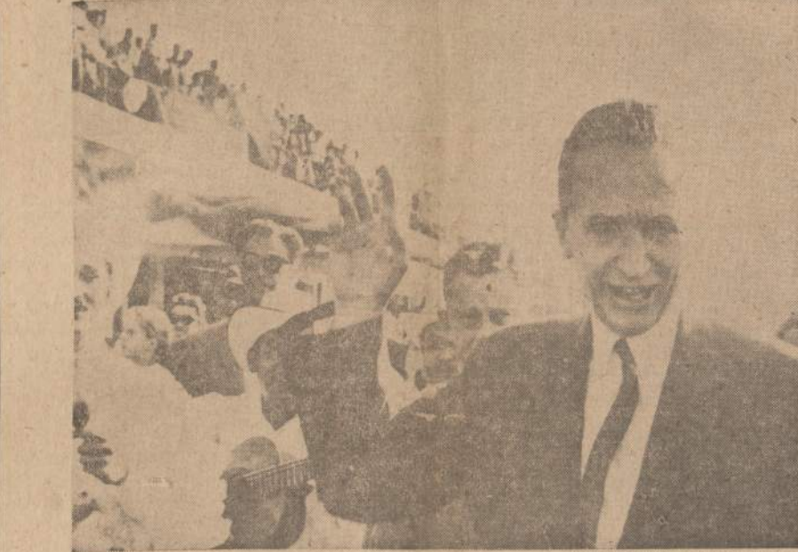
JAV ambasadorius Philip W. Bonsai moja kubiečiams, grįžęs į savo postą Havanoje, kur vėl bandys gerinti nuolat blogėjančius Kubos santykius su Jungtinėmis Valstybėmis. Vos ambasadoriui grįžus, Kubos prezidentas Osvaldo Dorticos viešai apkaltino JAV "nenugincijamą sabotu" ir "kriminaliniais oro užpuolimais".

Kompanijoms iš to susidaro dideli medžiaginiai nuostoliai. Tai gali su laiku priversti prie finansinio bankroto, sako kompanijų vadovai.