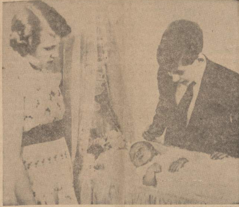
Britų princesė Anne ir princas Charles susipažista su savo naujausiu broliuku, princu Andrew, Buckinghamo rūmuose. Karalienės Elzietos trečiasis vaikas turi 4 vardus: Andrew, Albert, Christian ir Edward.

Adenaueris, suprastdamas sunkią Izraelio padėtį, ir pažadėjo tolesnę paramą, bet kitokia forma.