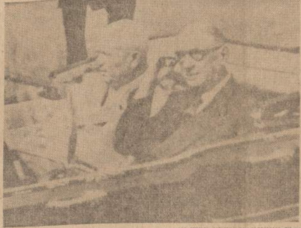
Aldarame automobilyje sėdi sovietų premjeras Nikita Chruščiovas ir Prancūzijos prezidentas Charles De Gaulle. Chruščiovas atvyko į Paryžių, kur jis praleis dešimt dienų.

Ceilono premjeras Senanayake KOLOMBAS, Ceilonas. — Dudley Shelton Senanayake, pakviestas sudaryti naują vyriausybę pasakė, kad jis nenori būti premjeru, bet jis nori išgelbėti Ceiloną nuo totalitarizmo — diktatūros. Premjeru jis jau buvo 1952-53 m. Jis priklausė konservatorių jungtinei partijai. Jis yra baigęs Anglijoje gamtos ir teisės mokslus. Jo tėvas buvo pirmuoju Ceilono premjeru.