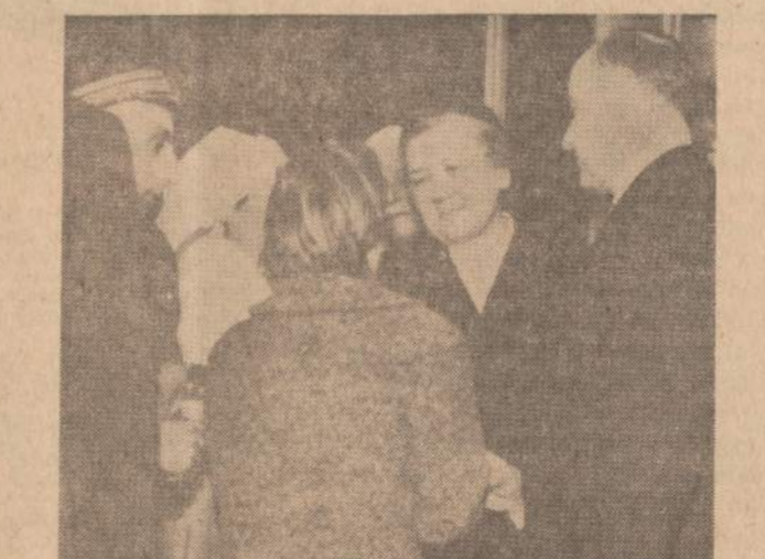
Chruščiovas žmona (viduryje) Paryžiuje aplankė vaikų ligoninę, kur prie jos pribėgo vengrai ir su ašaromis akyse maldavo, kad padėtų jai surasti Vengrijoje jos šešių metų dukrelę.

Fed. teisėjas Joseph McGarragh nusprendė, kad atsisakymas aiškintis į priešamerikinės veiklos k-to klausimus reiskia kongreso įžeidimą, už kurį jam gresia 1 metai kalėjimo ir $1,900 bauda. Silver uždėjo pareikalautą užstatą ir padavė apeliaciją aukštesniam teismui.