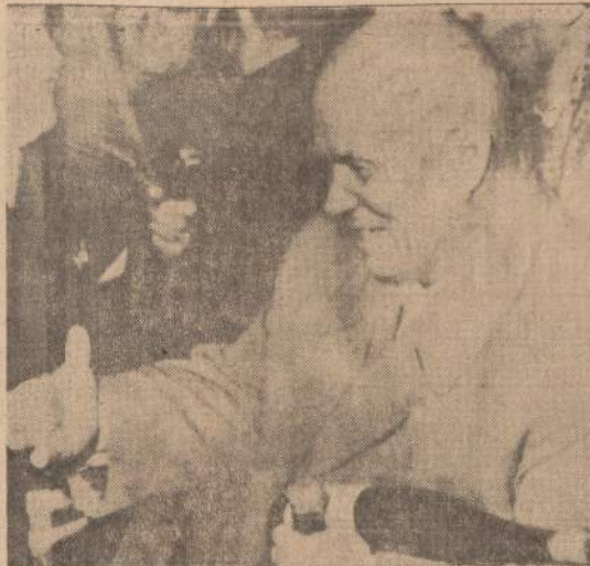
Nikita Chrusčiovas, važinėdamas po Prancūziją, užsuko į baltojo vyno gamybos sritį Pau, kur gavo dovanų, būtent, vyno, baltą ąriuką ir apskritą sūrį.