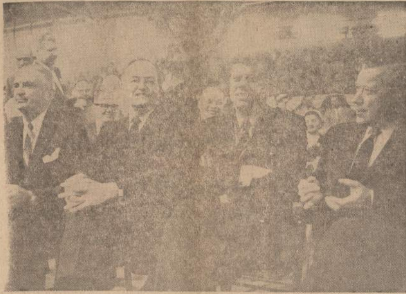
Trys demokratų kandidatai ir prezidentas (iš kairės ir dešinė) senatorius Stuart Symington, Hubert Humphrey ir John F. Kennedy, kalbasi su automobiliu darbininku (UAW) unijos prezidentu Walter Reuther Detroitė.

BUENOS AIRES. — Praėjus parlamento rinkimams, Argentinos sostinėje kitą dieną pasigirdo bomby sprogdinimai. Dvi elektros jėgainės buvo bombų apgrautos ir dalis miesto liko be šviesos. Viena sprogo netoli prezidento Frondizi namų.