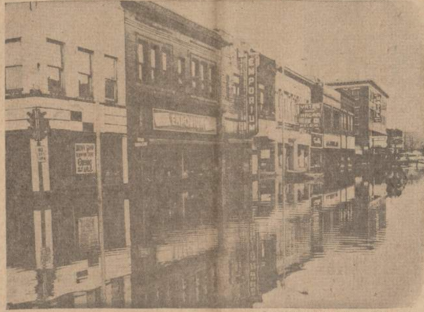
Hannibal, Mo., miesto trobesiai atsispindi patvinsusio Missisipi upės vandenyje. Hannibal ir netoli esančiam Quincy, Ill., miestui Missisipi upės išsiliejimas sudarė rimtą pavojų.