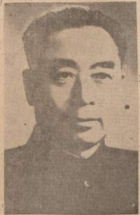
PABŪS Raudonasis Kinijos premjeras Čhou En-Lai, kalbėjamas "nacionaliniame liaudies kongrese", pasakė, kad Kinija nenorinti karo su JAV, bet norinti sėstis prie stalo ir pradėti derybas. Čhou neužigo atvyksta į Indiją savaitei laiko, tartis su Indijos min. pirmininku Nehru dėl bendrų sienų.