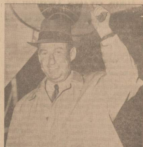
Adlai Stevenson, Chicago'is advokatas, dukart buvęs kandidatas į prezidentus, apkeičias 14 Pietų Amerikos kraštų, grįžo į JAV ir New York'e paklaustas, ar nemano vėl kandidatuoti, atsakė "Aš neįsivaikau nominacijos. Aš jos nesitikiu ir nemanau, kad man kas vėl pasiūlytų".

1920 m. gegužės 15 d. sušaukta Lietuvos Steigiamojo Seimo 40 metų sukaktis. Steigiamasis Seimas tikrai demokratinio būdu laisvuose rinkimuose buvo išrinktas balsavimu virš 90 procentų visų Lietuvos gyventojų.