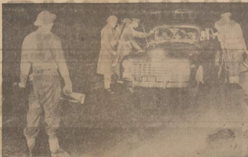
Durban (Pietų Afrikoje) policija ir kariuomenė užėmė strategines vietas, bandydami paleuzti negru pasipriešinimą prieš juos nukreiptiems patvarkymams. Pietų Afrikoje negry teisės yra labai suvaržytos.

Nuo mūsų čia atvykimo praėjo ne du šimtu metų, o tik dešimtis. Stovyklose turėjome savo aplinką, pradžioje net apvertę spygliuota viela. Taigi viskas dar čia pat, ranka pasiekiamo. Kiti dar nespėjome nė atšėvėtu drabužių sudėvėti. Didžiama, už vartų, dar gyvų mūsų artimiausių giminių, pažįtamų... O čia turime pilną savo lietuviškos bendruomenės sąstatą: kalbininkų, karių, amatininkų, politikų, kultūrininkų, mokytojų artojų, jaunimo, tik mažumenė čionykštė vyresniųjų užuovėjų. Ar ši pilna sąstato maža, kaip skelbiamės,