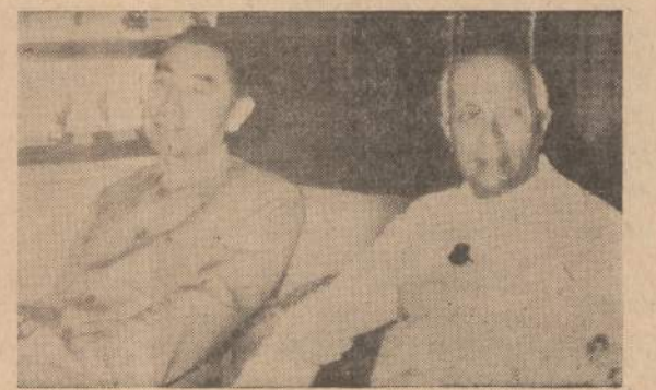
Kinijos komunistinės vyriausybės premjeras Chou En-Lai (kai- rėje) sėdi kartu su Indijos premjeru Nehru prieš konferencijos prasidėjimą New Delhi mieste.