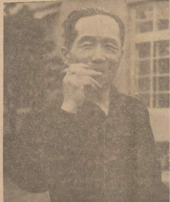
JAV padarė spaudimą į Pietų Korėjos prezidentą Syngman Rhee, kad šis pašalintų ginčytiną viceprezidentą Lee Ki Poong ir leistų pakartoti rinkimus, prieš kuriuos vyventojai smarkiai protestuoja.

Riaušinėnai pakorė policijos viršininką, kita pareigūnų iš- stūmė per langą iš 4-to aukšto. Teko šauktis kariuomenės iš kaimyninių vietų riaušinėnkams malšinti. Apie šimtą jų žuvo. Keli riaušių vadovai buvo nu- teisti mirties bausme.