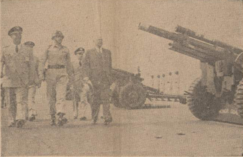
Prezidentas Eisenhoweris atskridęs į Fort Benning, Ga., apžiūri naujausius armijos ginklus. Čia matoma 105 mm gaubica (howitzer), kurios 21 50 yiu prezidentas buvo pasveikintas.

Sierra Leone buvo apgyvendinta negrų vergais po vergijos panaikinimo Amerikoje. Šiandien joje gyvena kiek daugiau kaip milijonas žmonių. Afrikoje dygsta nepriklausomos valstybės, didelės ir mažos, kaip grybai po lietaus. Jos, kaip taurė, paprastai nei rase, nei kultūra, nei praeitim nesiskiria nuo kitos. Jei ji buvo anglų valdoma kaip atskiras administracinis vienetas, šandien užtenka tik kraštų žmonėms pasiskelbti "tauta" ir pareikalauti "tautinės" nepriklausomybės.