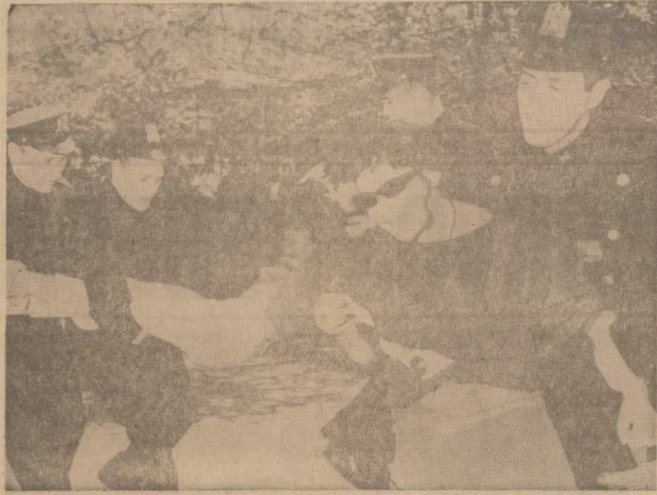
New Yorko policija veda į savo automobilį dvi moteris, kurios per atominio karo pratinimo si-rensms staigiant atsisakė bėgti slėptis. Viso buvo suimta 26 asmenys iš apie 150 piketinkų.