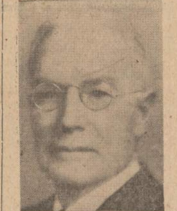
John D. Rockefeller Jr., dabartinio New Yorko gubernatoriaus Nelsono Rockefellerio tėvas, mirė Tucson (Ariz.) Medical Centre, kur buvo gydomas. Mirė sulaukęs 86 metų amžiaus. Jo tėvas buvo Standard Oil kompanijos steigėjas.