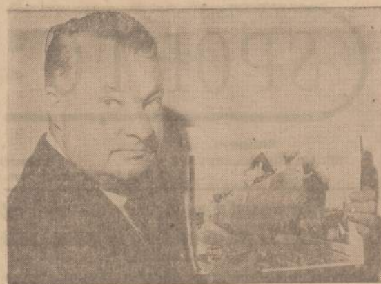
C. L. Johnson, U-2 sprausminio lėktuvo konstruktorius, studijuoja sovietų padarytą ir paskelbtą lėktuvo lauko nuotrauką, tvirtindamas, kad tai yra numuštojo amerikiečio lakūno Francis Gary Powers lėktuvas. Johnson sako, kad nuotrauka reikia dar nuodugnai iširti, kol bus galima pasakyti, ar tai tikrai Amerikos lėktuvo būta.