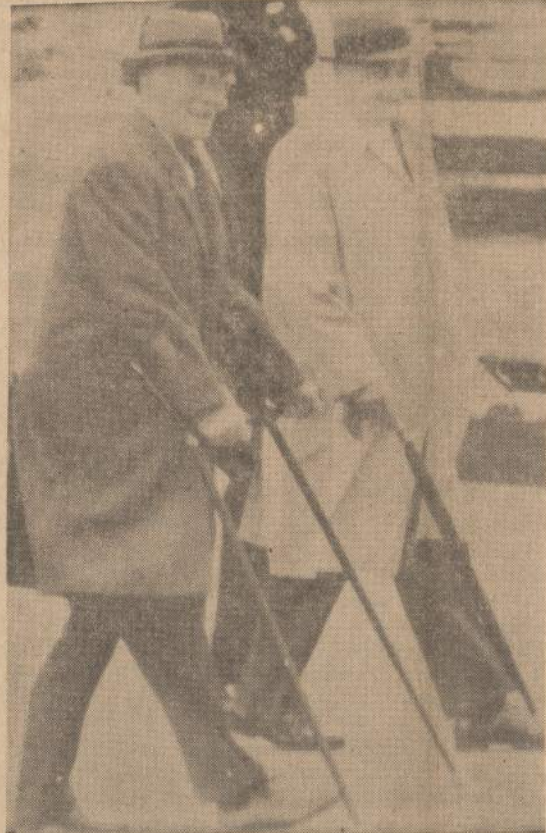
Valstybės sekretorius Christian Herter (kairėje), atskridęs į Paryžių, dalyvauja "viršūnių" konferencijoje. Jis sakėsi laikysis "šėšelyje", nes tai esąs spektaklis, kuriame turi pats prezidentas vaidinti.

Praėjus daugiau nei metams laiko nuo Castro pergalės, vis daugiau studentų rodo nusivylimą Castro valdžios simpatizavimu komunistams. Iš 18,000 Havanos studentų komunistus palaiko gal tik kokie 5%. Pusė laikosi neutraliai.