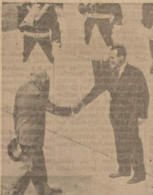
VIRŠŪNIŲ KONFERENCIJA: Amerikos prezidentas Eisenhoweris, atvažiuojantis Paryžiuje prasidėjusia "viršūnių" konferencija, pasitinka prancūzų premjerą Michel Debre. Dešinėje: sovietų delegacija atvažiuojanti autobusais į konferenciją. Sovietų ambasadorius Prancūzijoje Sergej Vinogradov ir Nikita Chruščiovas, užpakalinėje sėdynėje sovietų gynybos ministeris Rodin Malinovskis, vertėjas (pusiau uždengtas), ir sov. už. reik. min. Andrei Gromyko.

Tarptautinė įtampa dabar paastrės. Šaltasis karas tęsis — kol Kremliaus gengsteriai nenusisuks sprando.