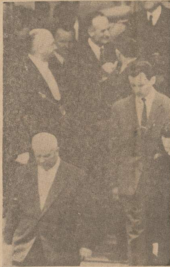
Nikita Chruščiovas (priešakyje) apleidžia vos tik prasidėjusią "viršūnių" konferenciją Paryžiuje, kurios susprogdinti jis specialiai čia atvyko iš Maskvos.

• Trečiasis posėdis tarp Eisenhowerio, De Gaulle ir Macmillano antradienio vakarą užtruko tik 15 minučių. Vakarų diidieji dar nėra tikri, kad Chruščevas trečiadienį apsis Paryžiu.