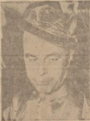
Princas Aly Khan, 48 metų, buvęs Pakistano ambasadorius Jungtinėms Tautoms, didelis arklių ir moterų mėgėjas, šiomis dienomis Prancūzijoje užsimušęs automobilio nelaimėje.

Paklaustas, kas atsitiks tuo atveju, jei rusai pasirašys sutartį su savo saulėtine ryto. Vokietija ir tuo būdu alkis vakariečiams susisiekimą su vakariniu Berlynu, sen. Douglas atsakė: "Asmeniškai aš manau, kad mes tokiu atveju turėtume pasiūlyti tankus".