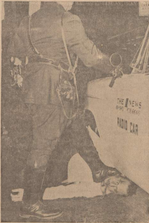
New Yorke prie Kubos konsulato Manhattane tarp Fidel Castro šalininkų ir priešinkų įvyko smarkios muštynės. Buvo pašaukta policija, kuri atstovė tvarką. Vaizde New Yorke policininkas, koją sprandą prispaudęs, bando nuraminti vieną įtūžusį riaušinininką.

Prieš pat konferenciją žvalgybos triukšmas parodė Maskvai, kad ji nėra tikra, jog jos paslapčių niekas nežino, pasiruošimų ar veiksmų neseka. Nors nemalonus ir neleistinis priemonės tenka naudoti, bet apsidrausti netikėtumams, sužinoti, ar grasinimai realūs, ar tik slapalai, ypatingai, kai pati Maskva slaptiems žinių rinkimams nevensgia jokių priemonių, yra bėds Maskva. Iš to, kas jau yra