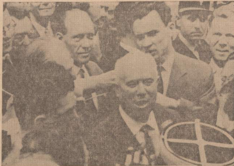
Nikita Chruščiovas įteikęs prezidentui Eisenhewerui "ultimatumą" ir neįsėjęs patenkimo, pasakoja reporteriams prie Sovietų ambasados Paryžiuje, kad jis išvažiuoja iš kur atvažiuos.