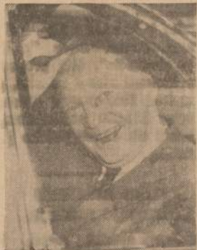
Syposdamasis prezidentas Eisenhoweris šieina iš JAV ambasados Paryžiuje, vykdamas pasitariti su britų premjeru Macmillanu ir prancūzų prezidentu De Gaulle po to, kai Nikita Chruščiovas atsisakė dalyvauti "viršūnių" posėdyje, tuo būdu sugrąžindamas dar nepradėtą konferenciją.

— Deja, po pirmo pamėginimo apsisvežčiau, tai taip ir nebūvo progos išmokyti, mieloji ponija.