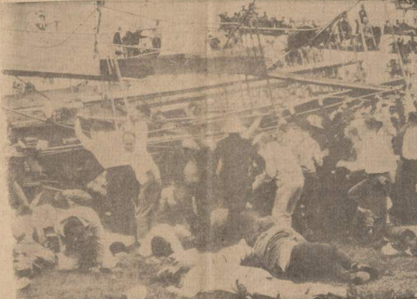
Per automobilių lenktynes Indianapolyje sugriuvo 30 pėdų aukštumo sėdynių patostas ir visi viršuje sėdėję žmonės kartu su pastatu nugriuvo ant apačioje sėdėjusiųjų. Nelaimėje du žmonės mirė ir 70 buvo sužeista, trys labai rimtai.

Bonos vyriausybė nemato reikalo į tokius klausimus atsakinti.