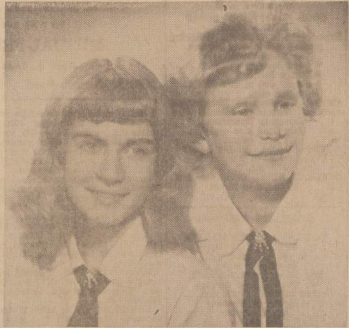
Pavasariniam NAUJIENU piknikui, kuris birželio 12 dieną vyks Bučo Sode, kiekvienas elgiasi turės progos ne tikai su jomis susipažinti, bet ir užgirsti jų dainuojamų gražių lietuviškų dainų.