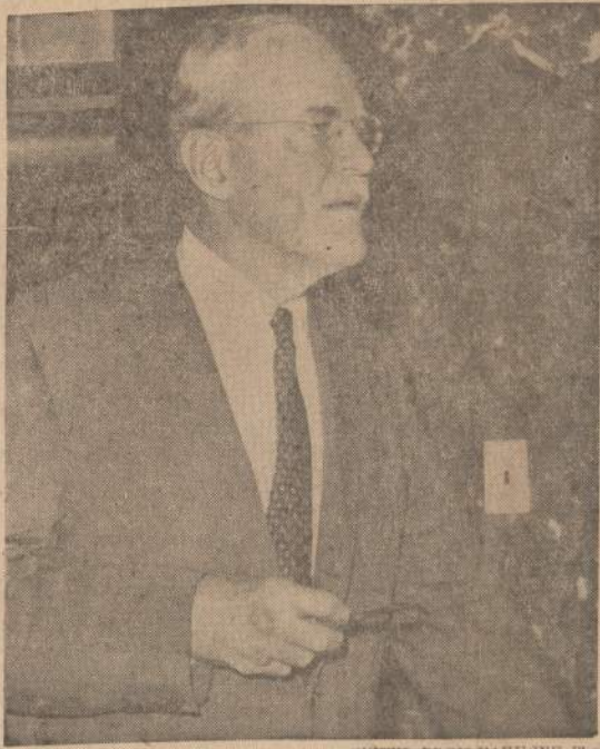
Allen W. Dulles, Central Intelligence Agency direktorius, atvykęs į naujuosius Senato rūmus Washingtono lūdyti slaptos sesijos dėl U-2 lėktuvo bylos. Apklaudinėjimo metu nebuvo leista daryti jokių fotografinių nuotraukų.