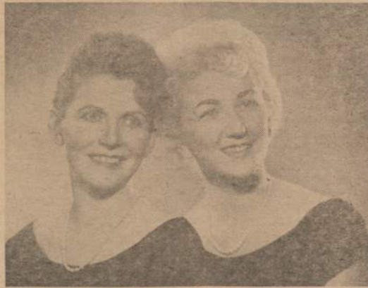
Naujienu Piknike dainuos ir šoks šios dainininkės