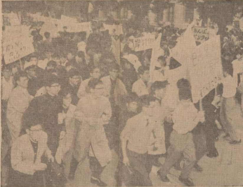
Tūkstančiai demonstrantų Tokyje maršuoja prie parlamento rūmų. Jie mosikuoja plakatais, ant kurių užrašyta: "Ike Stay Home".