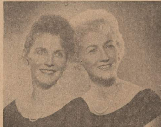
Naujienu Piknike dainuos ir šoks šios dainininkės